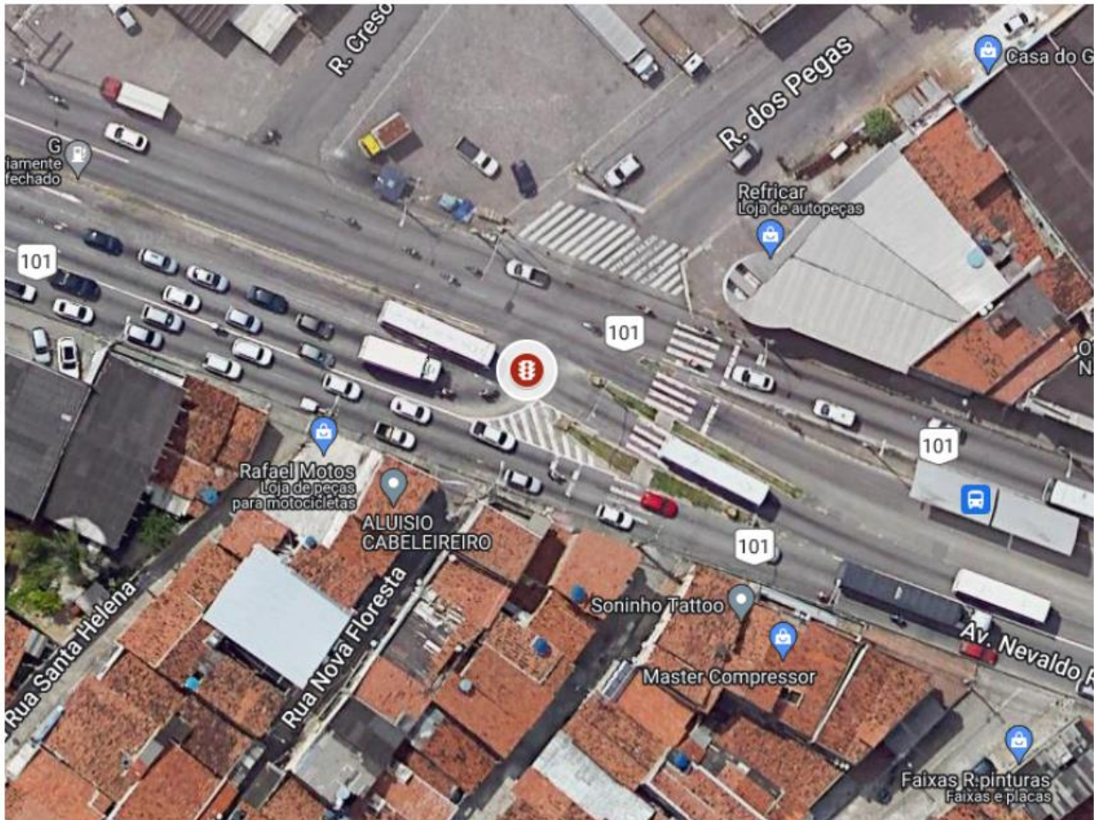
Figura 1 - Vista Superior