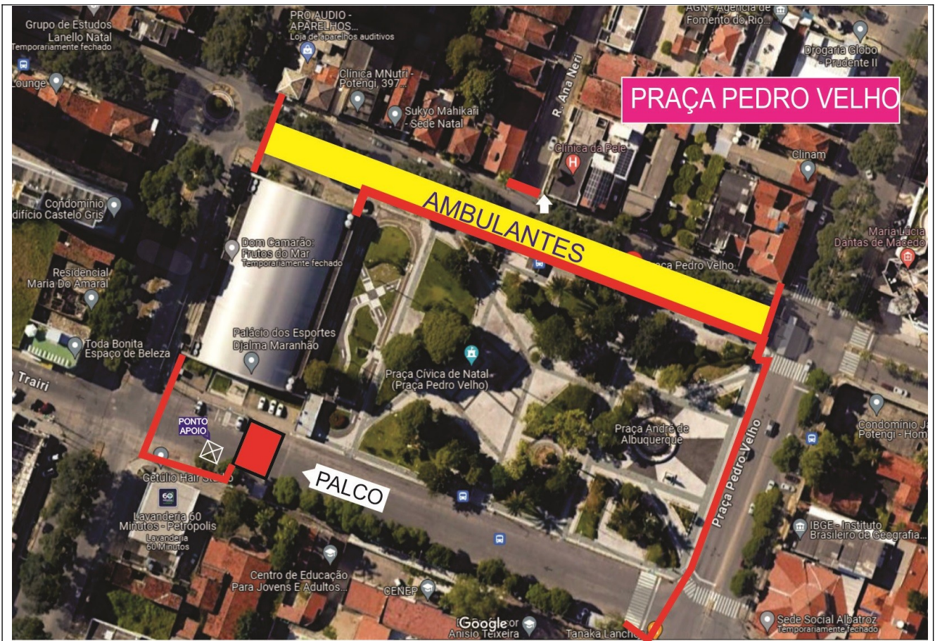
03 – Pólo Petrópolis