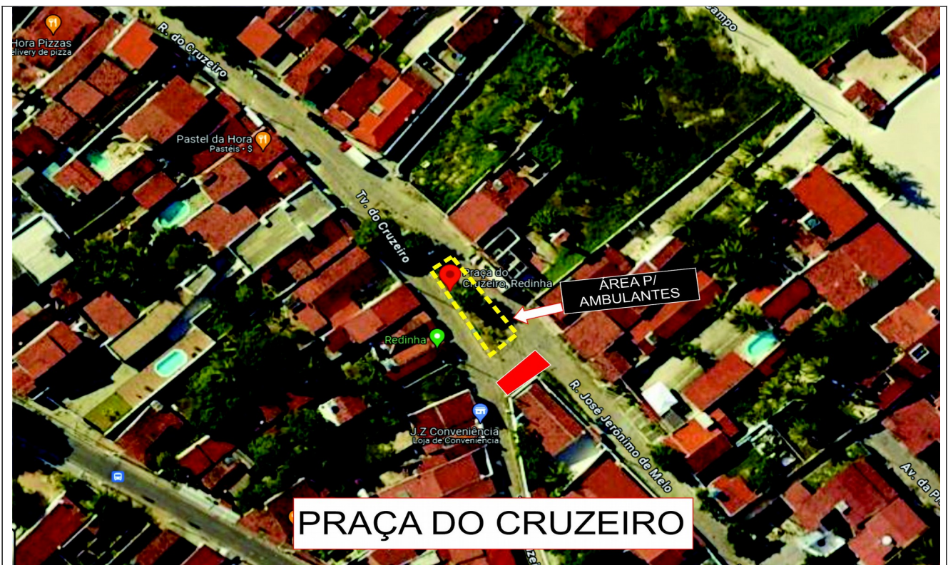
04 – Pólo Cruzeiro Redinha